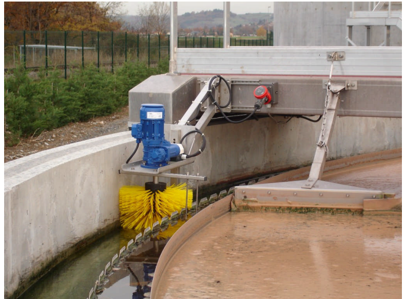
MONOBROSSE en condition de fonctionnement

La fréquence de remplacement des brosses dépend du mode d'utilisation mais leur durée de vie est au minimum d'un an. Les matériaux utilisés pour la construction de cet appareil sont, bien entendu, adaptés pour l'environnement sévère auquel il est confronté.