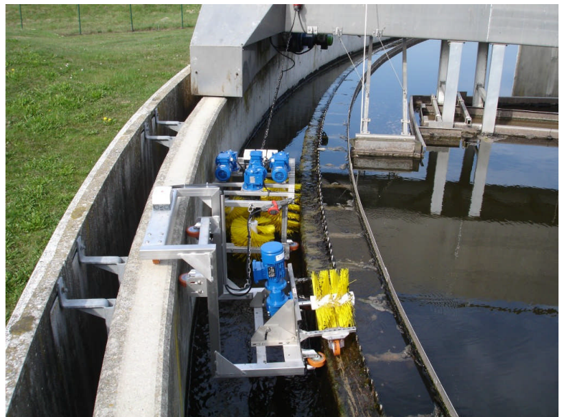
Ensemble complet AUTOBROSSE

La puissance totale installée ne dépasse pas 480 W et il n'est pas indispensable de faire fonctionner les brosses en continu. Le simple passage des chariots tractés par le pont permet de maintenir l'état de propreté du canal. La rotation des brosses apporte cependant une meilleure efficacité tout en répartissant l'usure sur l'ensemble de leur circonférence.