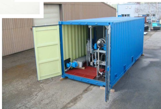
MOBIL DEHYDRATION UNIT

TMI équipe des containers de transport ( 20 ou 40 pieds ) ou aménage des bungalows sur mesure pour vous proposer un ensemble clé en mains . Postes de préparation de polymère, bacs de coagulation et floculation, centrifugeuse, décanteur lamellaire... Ces équipements peuvent être intégrés et raccordés à l'intérieur du container que nous vous proposons pour abriter l'ensemble.